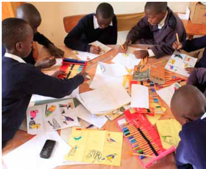
Die Knaben der sechsten Klasse beim Zeichnen der Anhänger für Weihnachtsgeschenke und der Buchzeichen, die Sie mit dem Weihnachtsbrief aus Nairobi erhalten haben.