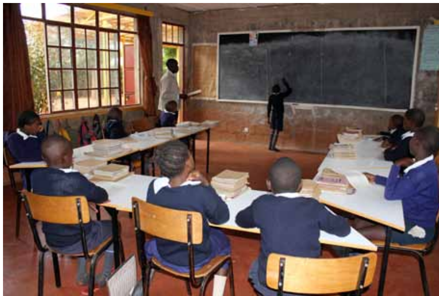
Die familiäre Atmosphäre der Hongera Klasse stärkt die Kinder.

Aufgrund unserer Erfahrungen hat sich der Schulversuch bewährt. Zum Teil geradezu auffallend haben sich die schulischen Leistungen aller Hongera Kinder verbessert. Das ist relativ einfach messbar, weil die Hongera Schülerinnen und Schüler sämtliche Prüfungen mit ihrer angestammten Klasse machten. Drei Viertklässler der